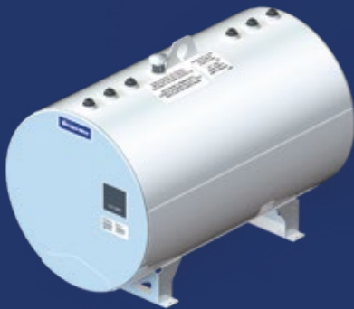
Double fond avec détecteur de fuite visuel Double bottom with visual detector